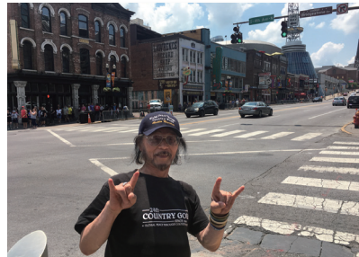
ナッシュビルの街角で。2018年頃。