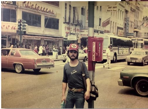
ナッシュビルの街角で。1982年頃。